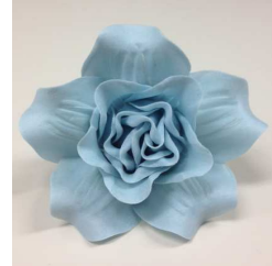
ソニアローズ S-SB(スモークブルー)