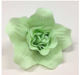
ソニアローズ S-LG(ライトグリーン)