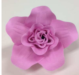
ソニアローズ S-LP(ライトパープル)